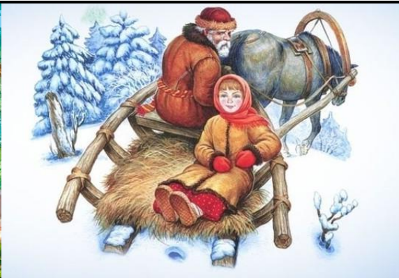
Сказка № 6.