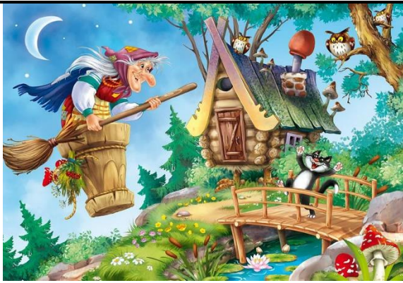
Сказка № 5.