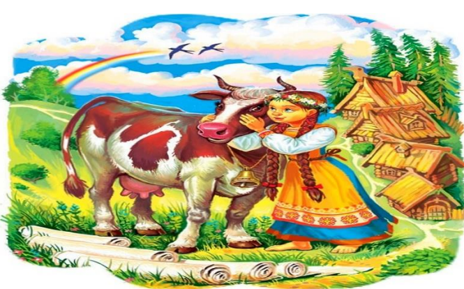
Сказка № 4.