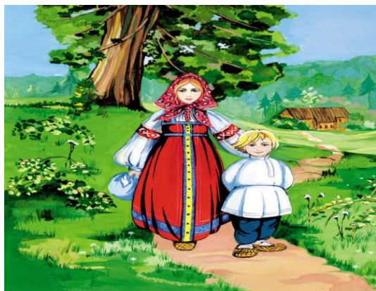
Сказка № 3.