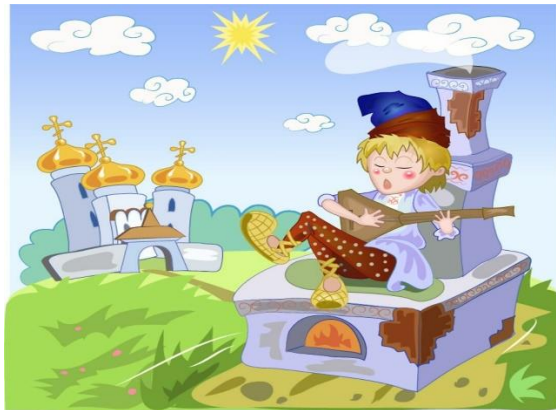
Сказка № 7.