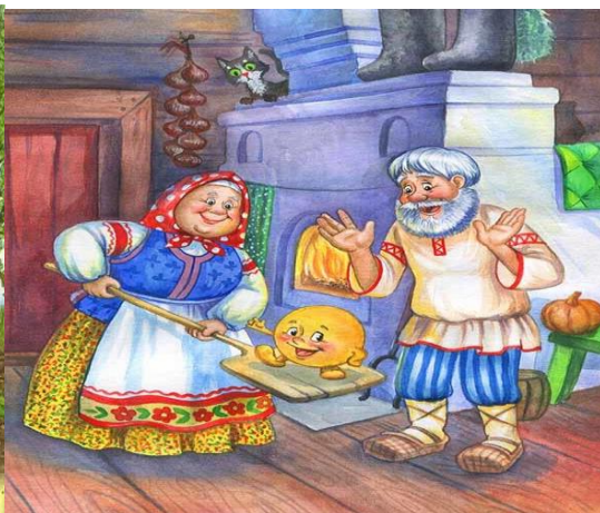
Сказка № 10.